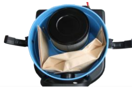
・吸気フィルター