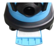
・排気フィルター