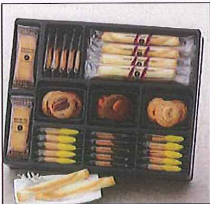
4 アンテノール エスプリ・アンテノール ラングドシャ エクセラ×8、ラングドシャ ショコラ・ラング ドシャ シトロン×各10、ビスキュイ オ ショコラ×8、 フティガトー セック×15(3種)