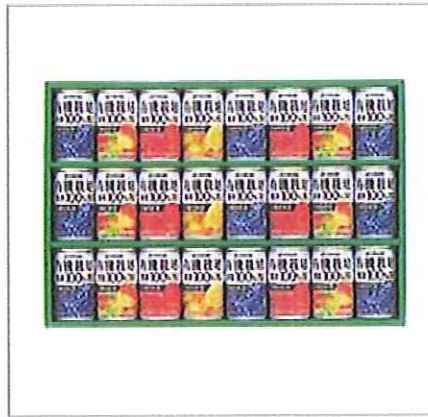
5 伊藤園 有機果樹園ギフト 有機オレンジ×3・有機りんご・有機フルーツミックス ×各6・有機ぶどう×9(各160g)、濃縮果汁還元