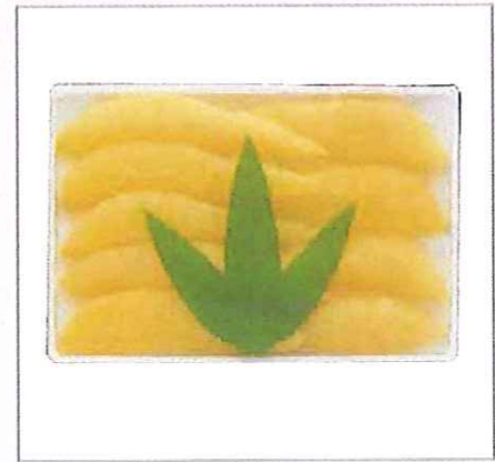
9 塩数の子 塩数の子280g(8~10本) 【賞味期限=冷蔵で5ヶ月】 ※原料はアメリカ製です。