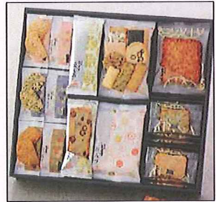
6 あられとよす 豊楽撰 お八つ・豆しお×各6、ほうろくたまり・黒のり・えび ×各9、豊楽抄醤油×4、豊楽抄青のり・桜えび×各7