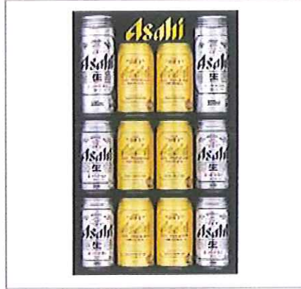
2 アサヒ スーパードライプレミアムペアセット スーパードライ(350ml)×4・(500ml)×2 ・スーパードライプレミアム(350ml)×6