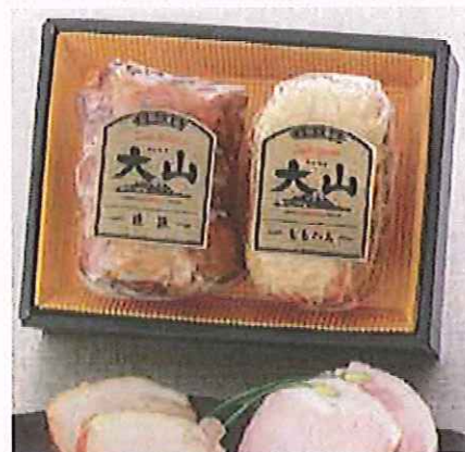
8 大山ハム ももハム・焼豚セット ももハム・焼豚(各340g)×各1 【賞味期限=冷蔵で45日】