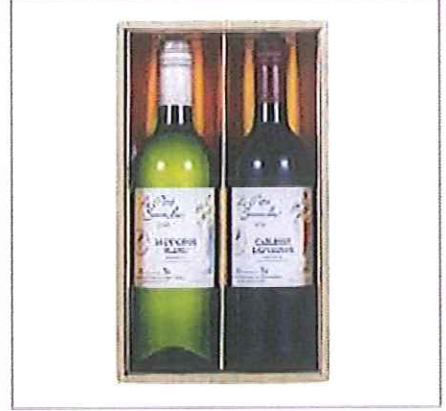
3 フランス金賞受賞ワインセット パリコンクール2012年金賞受賞ワイン ルプティ ソムリエ カベルネソーヴィニオン2011赤(ミティアムボティ) パリコンクール2011年金賞受賞ワイン ルプティソムリエソーヴィニオンブラン2010白(辛口)×各1(各750ml)